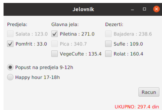
Slika 2: Klik na dugme Racun