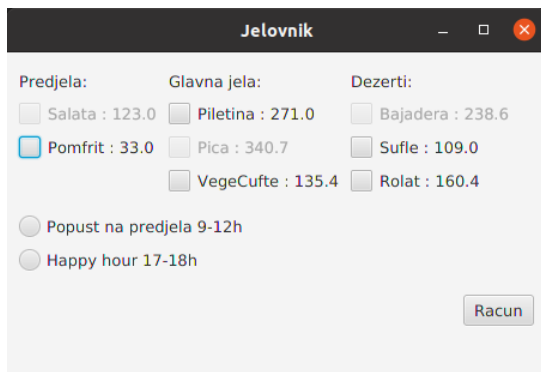
Slika 1: Početni izgled aplikacije