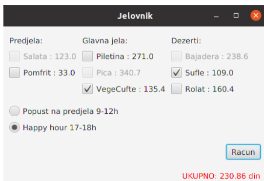
Slika 3: Klik na dugme Racun